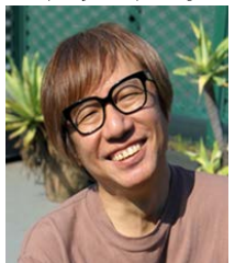
ことぶき しりあがり 寿

1958年静岡市生まれ。1981年多摩美術大学グラフィックデザイン専攻卒業後、キリンビール株式会社に入社し、パッケージデザイン、広告宣伝等を担当。1985年単行本『エレキな春』で漫画家としてデビュー。パロディーを中心にした新しいタイプのギャグマンガ家として注目を浴びる。1994年独立後は、幻想的あるいは文学的な作品など次々に発表、新聞の風刺4コママンガから長編ストーリーマンガ、アンダーグラウンドマンガなど様々なジャンルで独自の活動を続ける一方、近年では映像、アートなどマンガ以外の多方面に創作の幅を広げている。