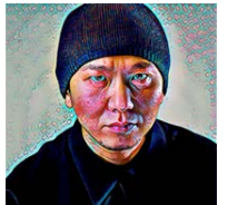
てんみょうや ひさし 天明屋 尚

1966年東京生まれ。現代美術家。日本伝統絵画を現代に転生させる独自の絵画表現「ネオ日本画」を標榜し、権威主義的な美術体制に対して、絵で闘う流派「武闘派」を2000年に旗揚げ。2010年には、南北朝期の娑婆羅、戦国末期の傾奇者といった、華美(過美)で覇格(破格)な美の系譜を“BASARA”として提唱。主なグループ展に、2002年「天明屋尚と暁斎展」(埼玉、河鍋暁斎記念美術館)、2003年「The American Effect」(ニューヨーク、ホイットニー美術館)、2006年「ベルリン - 東京展」(ベルリン、ベルリン新国立美術館)、2010年「第17回シドニー・ビエンナーレ」(オーストラリア、シドニー)、「BASARA展」(東京、スパイラル)を主催・企画・キュレーション。2014年「異形の楽園:池田学・天明屋尚 & チームラボ」ジャパン・ソサエティ(ニューヨーク、アメリカ)など。