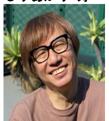
ことぶき しりあがり 寿

1958年静岡市生まれ。1981年多摩美術大学グラフィックデザイン専攻卒業後、キリンビール株式会社に入社し、パッケージデザイン、広告宣伝等を担当。1985年単行本『エレキな春』で漫画家としてデビュー。パロディーを中心にした新しいタイプのギャグマンガ家として注目を浴びる。1994年独立後は、幻想的あるいは文学的な作品など次々に発表、新聞の風刺4コママンガから長編ストーリーマンガ、アンダーグラウンドマンガなど様々なジャンルで独自の活動を続ける一方、近年では映像、アートなどマンガ以外の多方面に創作の幅を広げている。