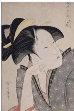
初公開「歌撰恋之部 物思恋」喜多川歌麿/画 蔦屋重三郎/版 1793年（寛政5）頃

寛政6年5月に河原崎座で上演された「 こいによぼうそめわけたづな 恋女房染分手綱」にて、市川鯉蔵（前名・五代目市川團十郎）が演じた竹村定之進を描く。堂々とした貫禄と風格を備えた鯉蔵の特徴を描き出し、写楽の作品の中でも最高傑作の一つ。力のこもった目の形象は、江戸東京博物館のロゴマークのデザインのもととなった。