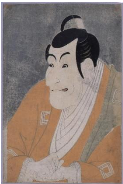
初公開「市川鯉蔵の竹村定之進」東洲斎写楽/画 蔦屋重三郎/版 1794年（寛政6）

東洲斎写楽「市川鯉蔵の竹村定之進」、喜多川歌麿「歌撰恋之部 物思恋」を常設展示室5階「江戸の美」のコーナーにて初公開