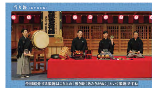
[基礎編] 体験! 発見! 歌舞伎の鳴物

「能」から伝わる小鼓、大鼓、締太鼓、能管・篠笛の特徴や掛け声など、伝統芸能を支えてきた「邦楽囃子」を紹介。