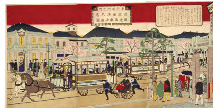
東京名所之内 銀座通煉瓦造鉄道馬車往復図(バナー)