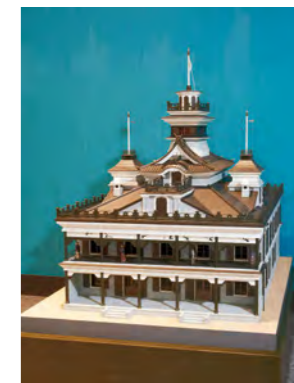
第一国立銀行(模型)