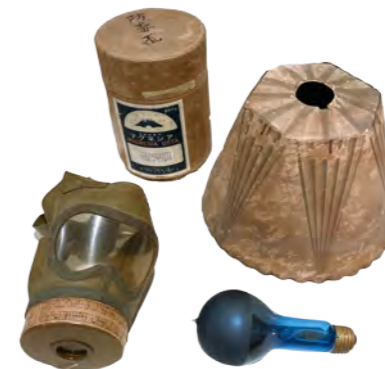
防毒マスク、灯火管制用電灯笠・電球