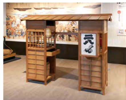
蕎麦屋の屋台(模型)